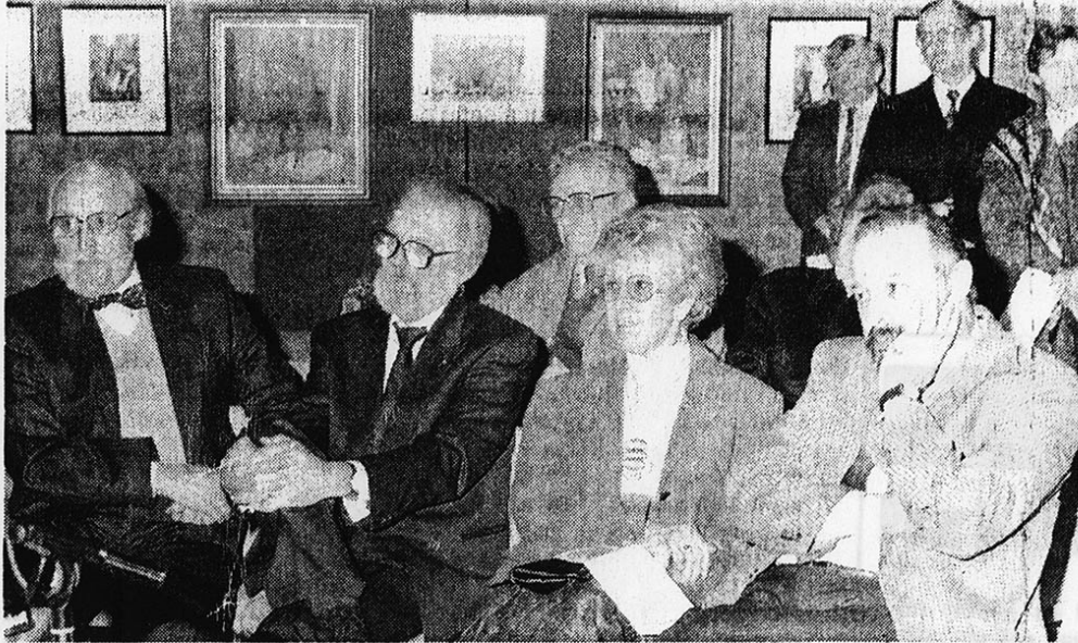
● Notre photo : les quatre artistes lors du vernissage.