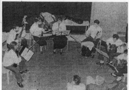
● L'ensemble « Polyphonia ».